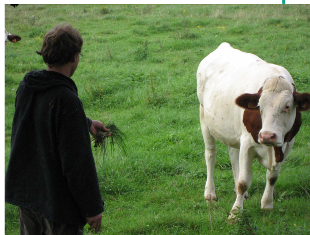
Nouvelle technique d'approche du PUMA

Une léchouille de tronc et le tour et joué !