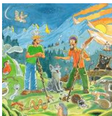
Dessin Alexis NOUAILHAT

Découvrir la nature à travers l'imaginaire, pour le plaisir des petits et des grands