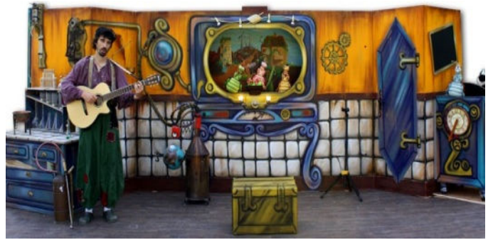
Scène spectacle ECOLOPOUX