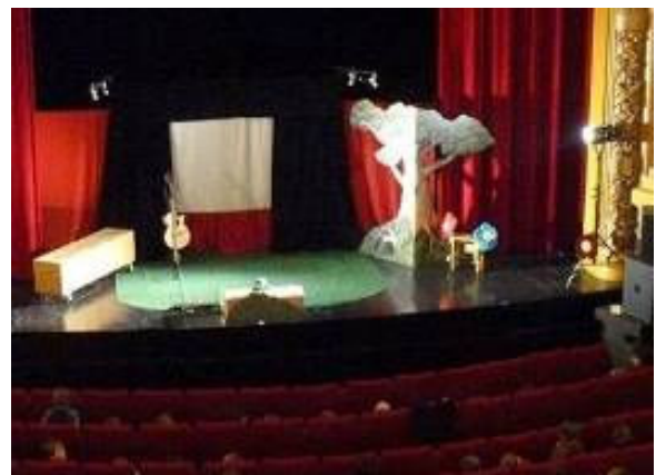
Scène spectacle SALSIFIS