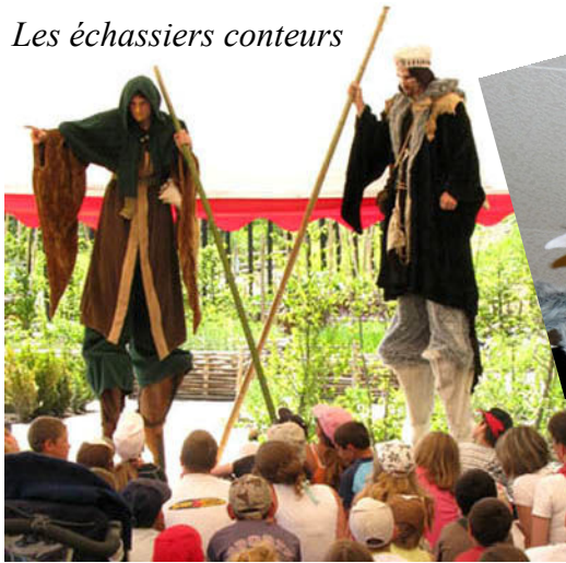
Les échassiers conteurs