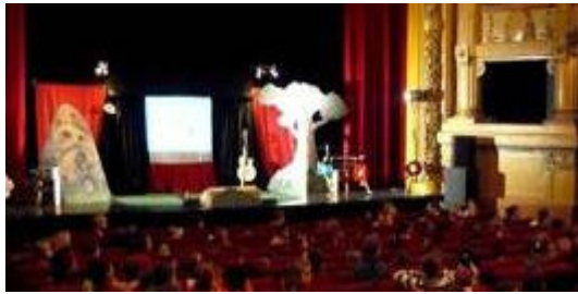
Scène spectacle RUFA