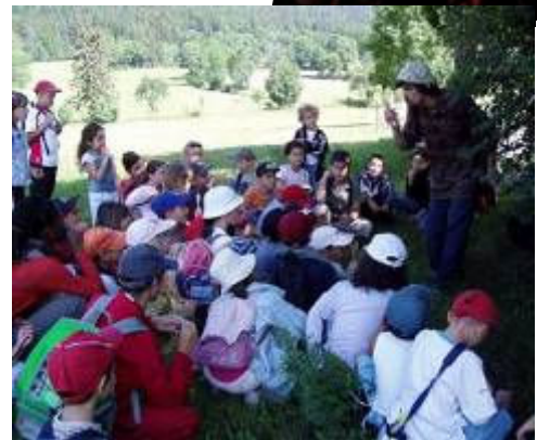
Spectacle contes nature